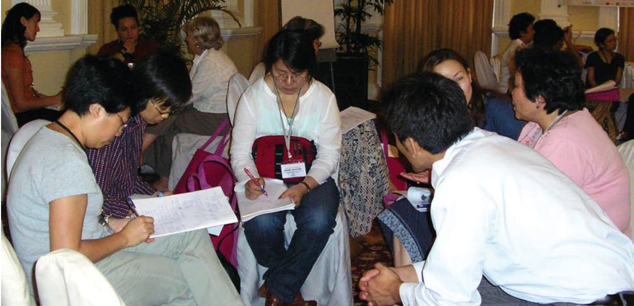
Taller sobre las acciones para futuras colaboraciones con las defensoras de derechos humanos.

Desarrollar estrategias de protección para las defensoras de derechos humanos contra los abusos a manos de los actores descritos en la primera parte de este informe es un paso esencial que debe darse para romper el ciclo de la violencia, una vez que el silencio acerca del abuso ya no exista más.