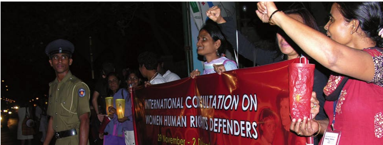
Caminata de solidaridad en colaboración con los grupos locales marcando los '16 Dias de Activismo' ; 30 de Noviembre de 2005, Galle Face Road Road, Colombo, Sri Lanka.

La primera consulta internacional sobre defensoras de derechos humanos proveyó a las activistas de más de setenta países de todo el mundo de tres recursos claves.