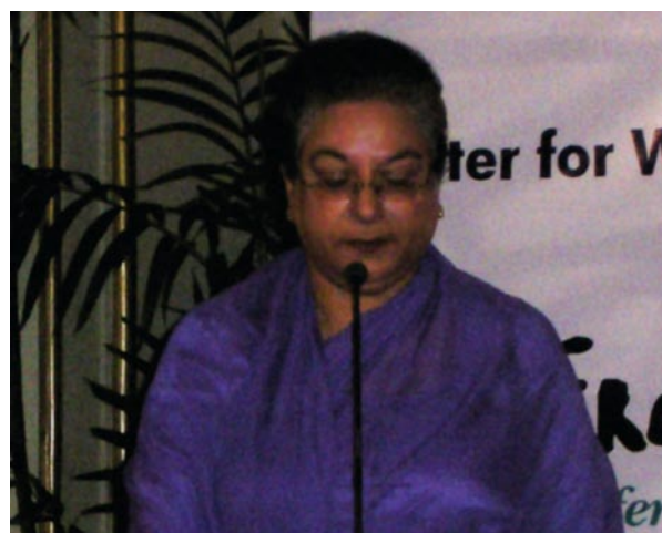
Hina Jilani, Representante Especial de Naciones Unidas sobre los Defensores de Derechos Humanos.

En muchos casos, estas clases de abusos son extremadamente efectivos en su finalidad de obstaculizar y detener la labor de las defensoras. Si la familia y la comunidad son usadas contra