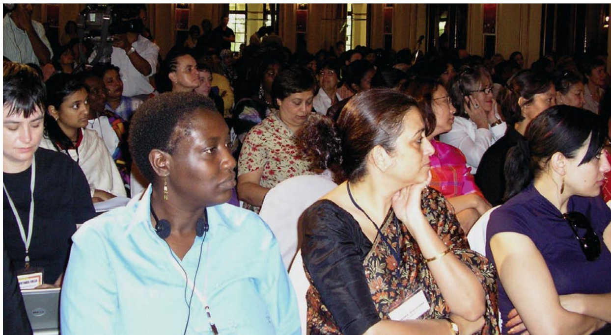
Participantes en la plenaria de apertura.